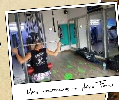
Mes vacances en pleine Forme