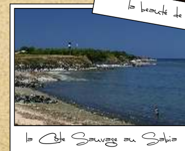
le Côte Sauvage au Sabia