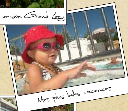
Mes plus belles vacances