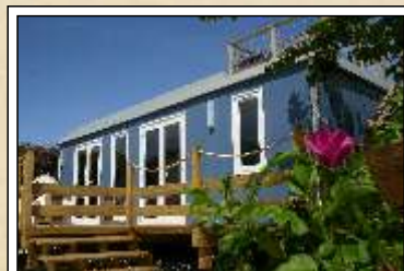
Mes vacances version Grand Large

retrouvez Sabi sur : www.facebook.com/campinglesabia