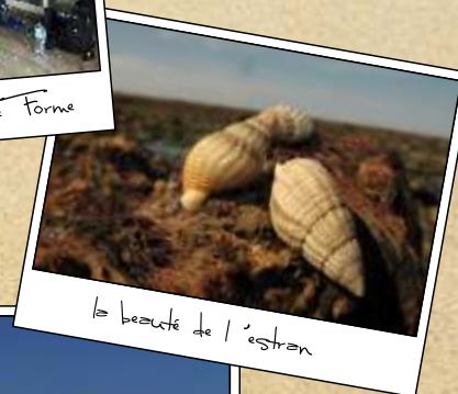
la beauté de l'estran