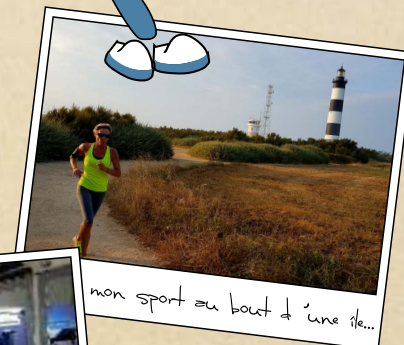
mon sport au bout d'une île...