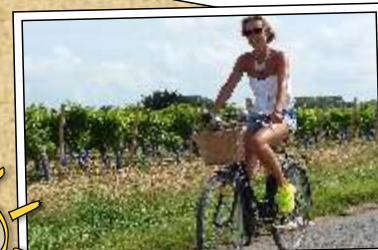
Mes plus belles balades à Vélo