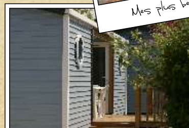
Mon logement au Sabia