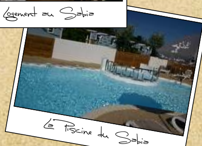
La Piscine du Sabia