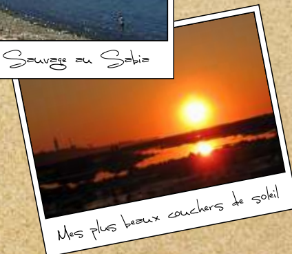
Mes plus beaux couchers de soleil